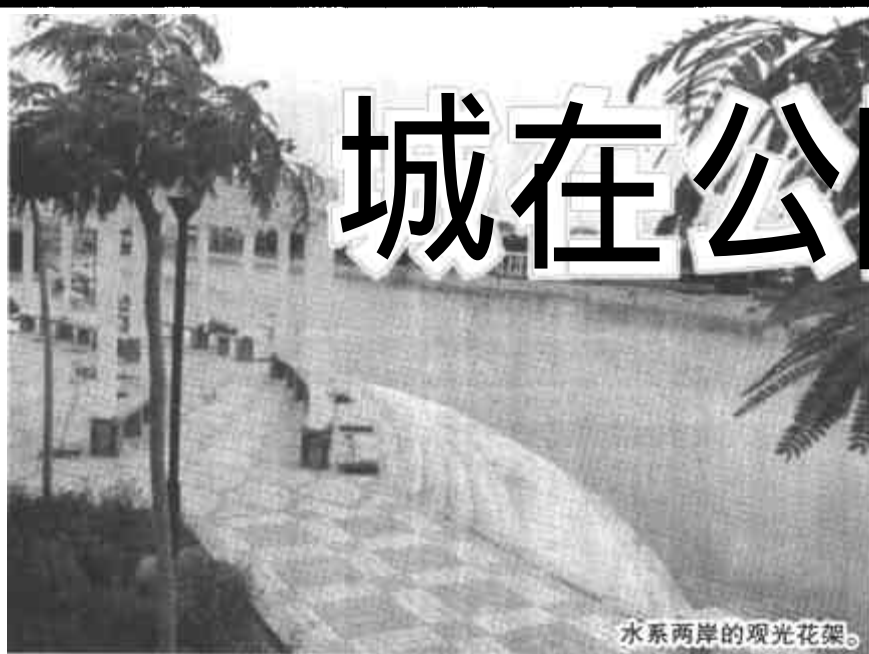
水系两岸的观光花架。