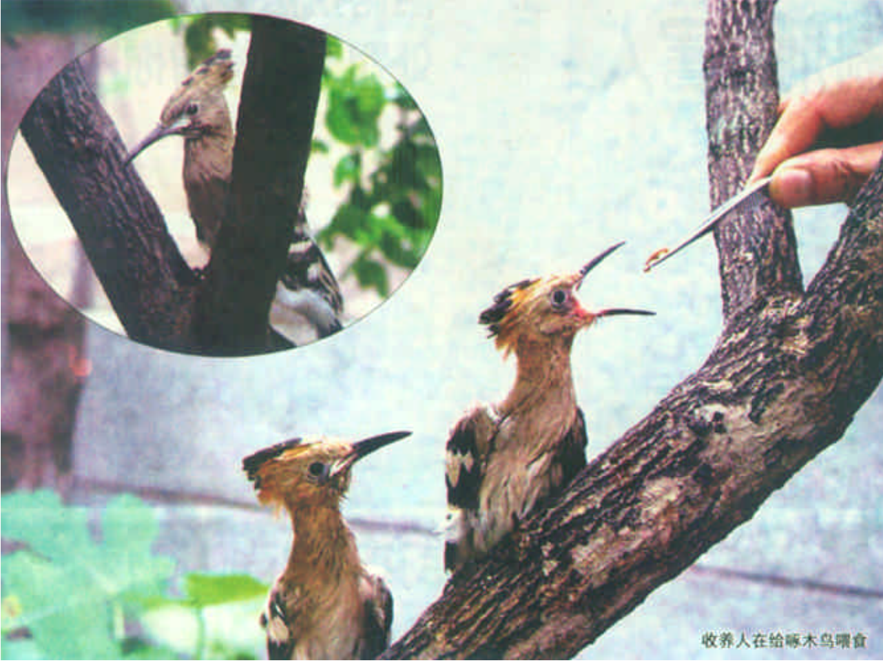
收养人在给啄木鸟喂食

参与居民身份证法草案起草工作的公安部治安局局长武冬立说：“为进一步完善居民身份证制度，加强居民身份证的管理工作，充分发挥居民身份证的作用，制定居民身份证法非常必要。”