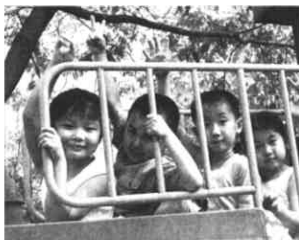
6月28日，几名小朋友在济南植物园拍照留念。当天是济南市各幼儿园放暑假的第一天，孩子们纷纷走出家门，尽享快乐暑假。

据新华社北京6月27日电 据《新民晚报》报道：“宇宙烟草”或许真能问世。在“神舟四号”上孕育的3万对太空烟草细胞目前在上海发育良好，代谢活动明显活跃，今秋有望抽出绿芽，绽放藕色小花。在中科院上海生科院植物生理生态所，“神秘”的微生物实验室近日第一次向媒体开放。“神舟四号”上的细胞融合促成了不同种细胞融合率和细胞融合率高成倍率，这两项指标分别是地球上的10.4倍和5.2倍。这预示着不久的将来，细胞在太空中的电融合实验有可能育出地球上难得一见的植物新品种。