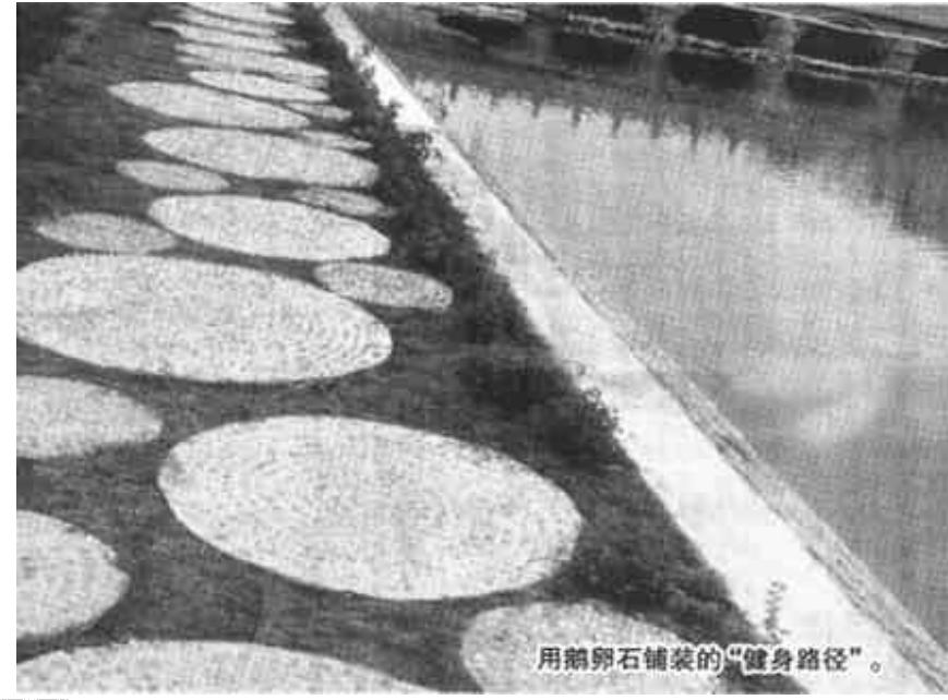
用鹅卵石铺装的“健身路径”。

环境在淮河路以南、广利河以北、东二路以西、胜利大街以东规划建设湿地公园，详细规划将于7月底之前完成。二是结合水系现状对部分地段进行绿化改造，主要内容包括碱土整形、客土石屑回填、给排水线铺设、苗木移栽及草坪播种等。目前东二路沿线、黄河路沿线、开发区沿线东岸、东营宾馆沿线东岸的绿化改造工作已经完成。三是建设园林景观和完善绿地功能。结合水系的改造，在辽河小区至水系芦沟桥沿线西岸作重点处理，充分运用各种景观布置手法，建设和创造丰富的园林景观。重点布置亭、台、廊、榭、景石、雕塑等景观小品及喷泉、叠泉、跑泉等水质景观和茶室、游憩码头等配套服务设施。采用丰富多样的铺装材料，利用灯光、雕塑等现代化手法，创造动态的景观序列，形成独特的水系景观。目前，已完成部分规划设计，正在实施政府采购，全部景观将在20周年“市庆”前夕与油城市民见面。